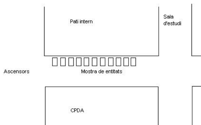
Fig3. esquema planta mostra d'entitats